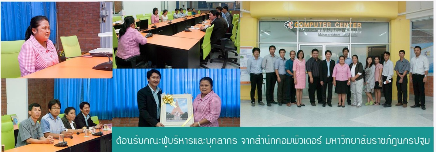
ต้อนรับคณะผู้บริหารและบุคลากร จากสำนักคอมพิวเตอร์ มหาวิทยาลัยราชภัฏนครปฐม

การจัดประชุมดังกล่าว มีวัตถุประสงค์เพื่อติดตามผลการดำเนินงานตามแผนกลยุทธ์สำนักคอมพิวเตอร์ ปีงบประมาณ พ.ศ.2557 รอบ 8 เดือน (1 ตุลาคม 2556-31 พฤษภาคม 2557) เพื่อแก้ไขปัญหา อุปสรรคการดำเนินงานให้บรรลุตามเป้าหมาย และตัวชี้วัดการปฏิบัติราชการตามแผนฯ ปีงบประมาณ 2557 รอบ 9 เดือน (1 ตุลาคม 2556 - 30 มิถุนายน 2557) โดยกำหนดให้ผู้ที่เกี่ยวข้องแต่ละตัวชี้วัดจัดส่งข้อมูลและเอกสาร การดำเนินงาน ให้คณะกรรมการภายในวันที่ 5 ของทุกเดือน เพื่อตรวจสอบเอกสารและยืนยันข้อมูลเข้าสู่ระบบต่อไป